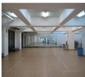
体育館 (保育学舎 3号館)