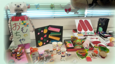
お店屋さん ごっこを 楽しむ