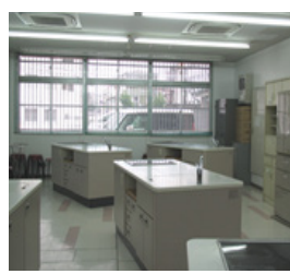
調理室 (保育学舎 1号館)