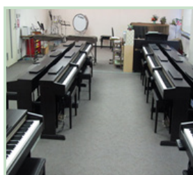
音楽室 (保育学舎 2号館)