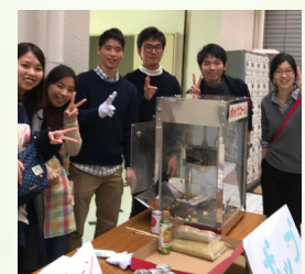
学園祭 ポップコーンの販売