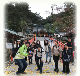
校外学習 中山寺へハイキング