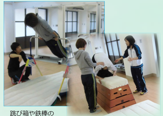
跳び箱や鉄棒の 指導方法を考える