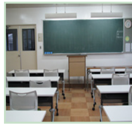
教室 (保育学舎 1号館)