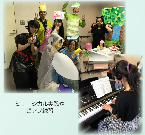
ミュージカル実践や ピアノ練習