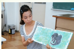
保育実習指導 絵本の読み聞かせ